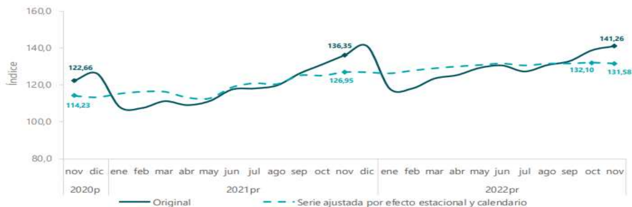
Gráfico 14. Índice de las actividades terciarias (base 2015) Serie original y serie ajustada por efecto estacional y calendario 2020 p - 2022 pr (noviembre)

Fuente: DANE, Cuentas nacionales p preliminar pr provisional